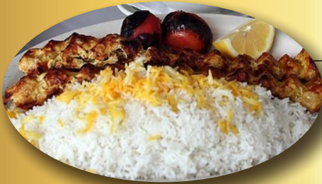
Shish Kebab with rice