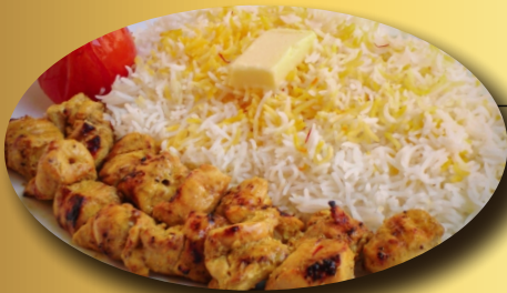
Chicken Kebab with rice

All Dishes served with Basmati rice and BBQ Tomato 350.-