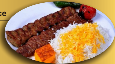
Lamb Kebab with rice