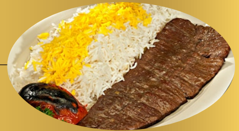
Beef Kebab with rice